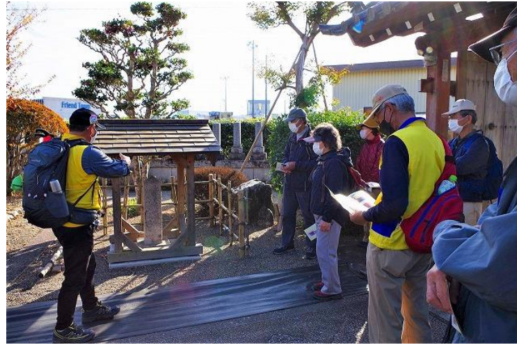
伏見城の戦いで籠城・討ち死にした甲賀武士の墓