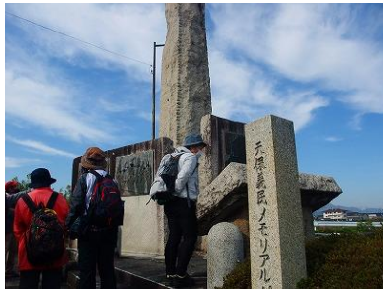
天保義民の碑／一周回ると当該事件（1842年）のあらすじが分かります