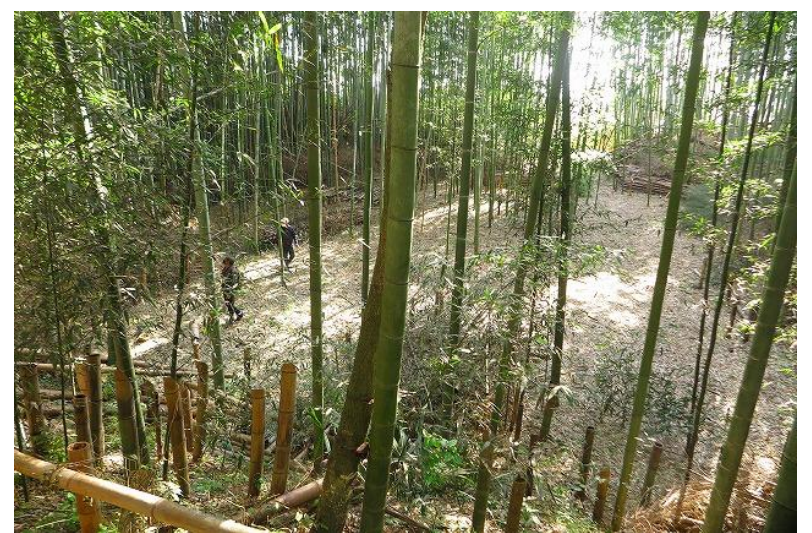
竹中城址／竹藪の中に土塁に囲まれた平城址がありました