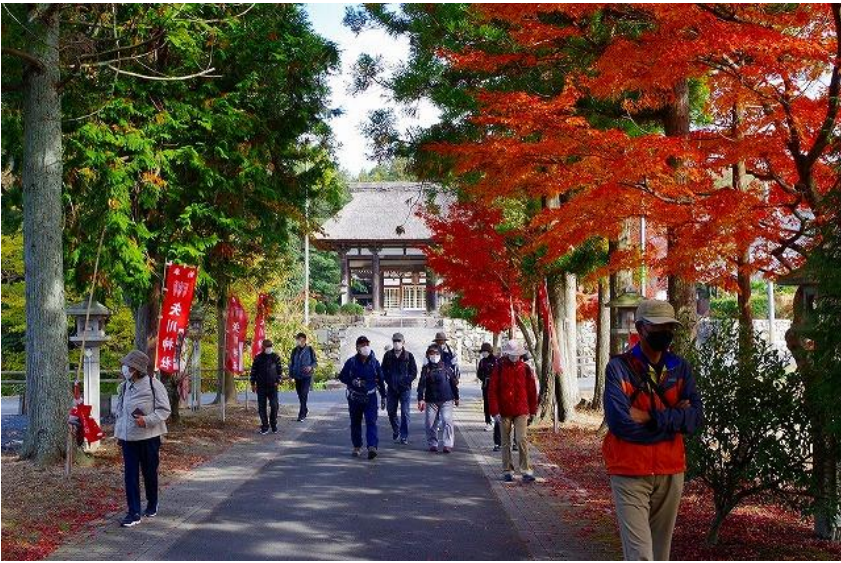
矢川神社参道の紅葉