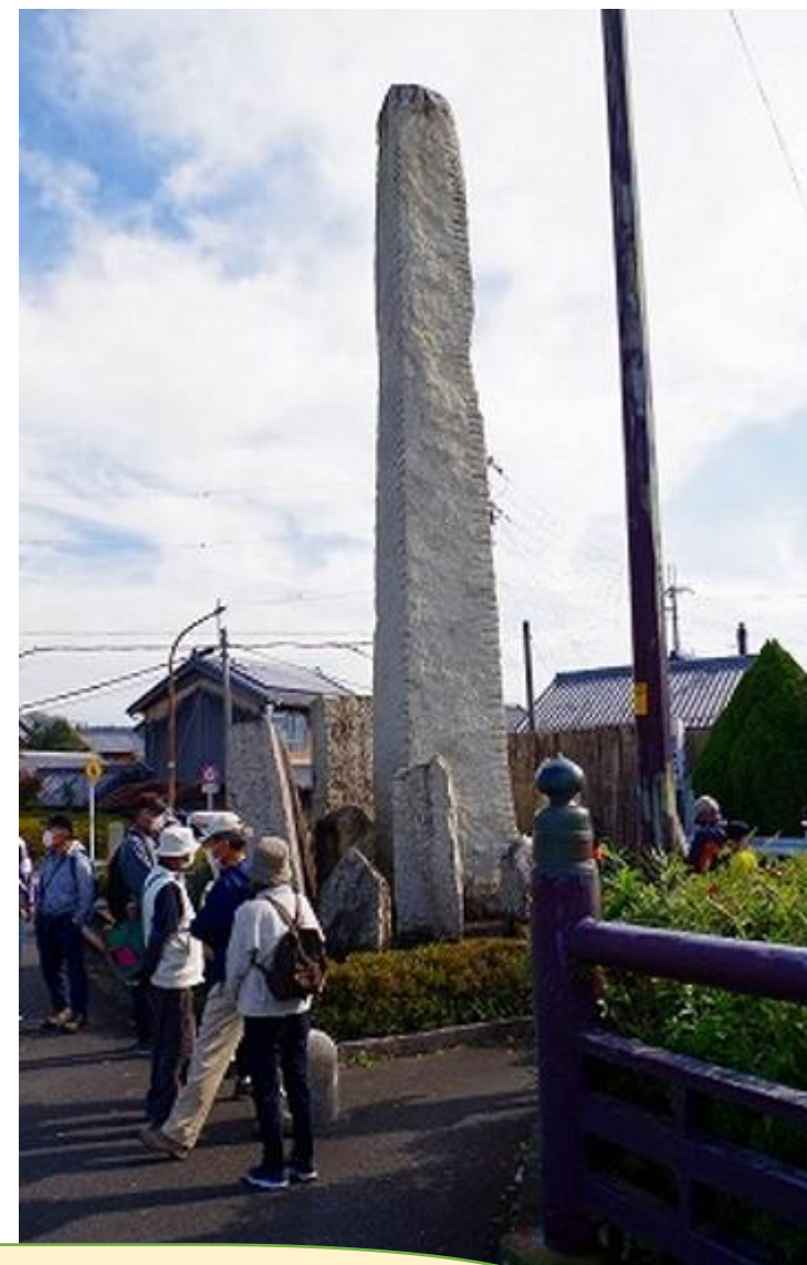
不正検地に反対した農民一揆／「検地10万日の日延べ」を勝ち取るが、指導者達は捕らえられ処刑された！