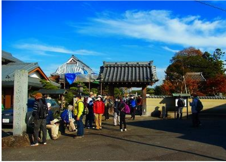
慈眼寺／約600年前の建立