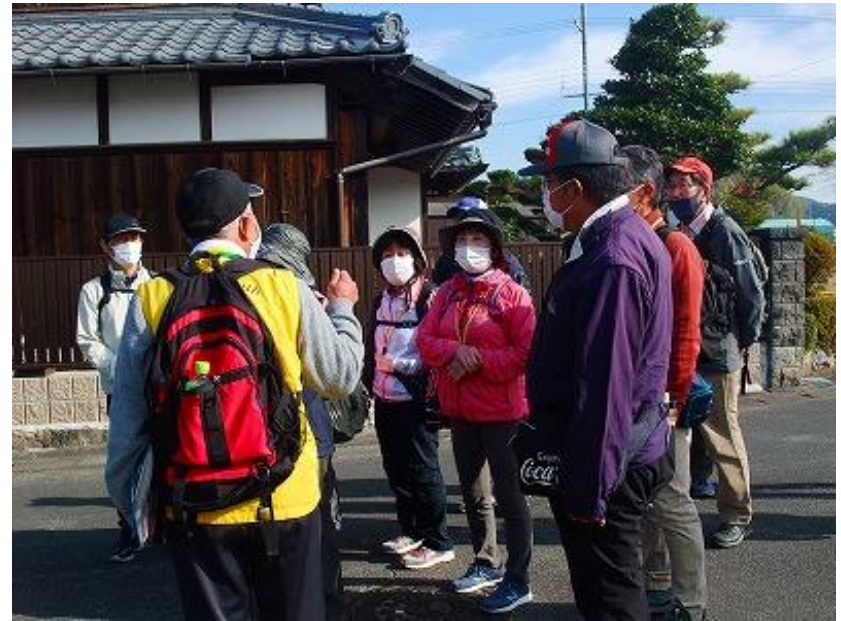
今日は最高の天気で久しぶりのウォーキングを応援してくれました