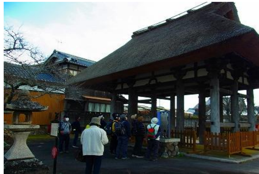
新宮神社表門／国重要文化財