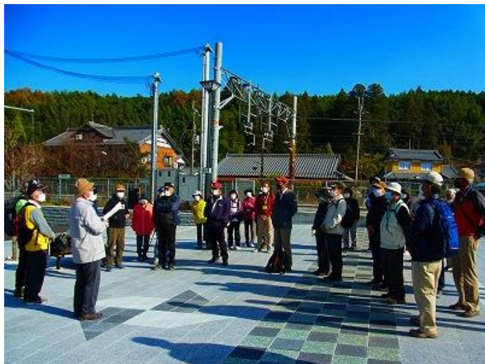
JR甲南駅での保田会長挨拶