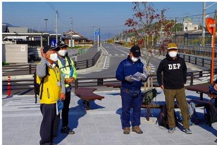
今日のボランティアガイドさんです（左の方はレイ大の先輩）