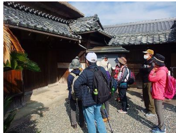
甲賀流忍術屋敷／望月出雲守の住居（元禄時代に建てられた旧宅）