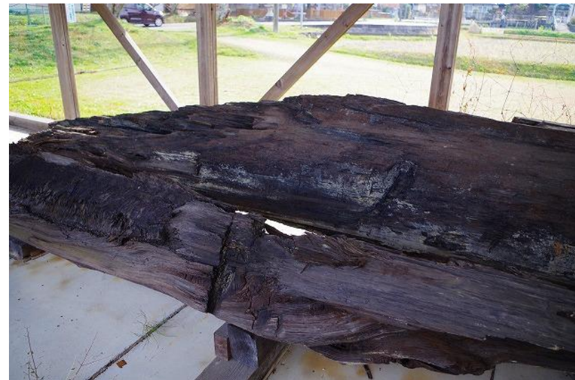
出土木材／西暦650年頃伐採された杉材が出土！