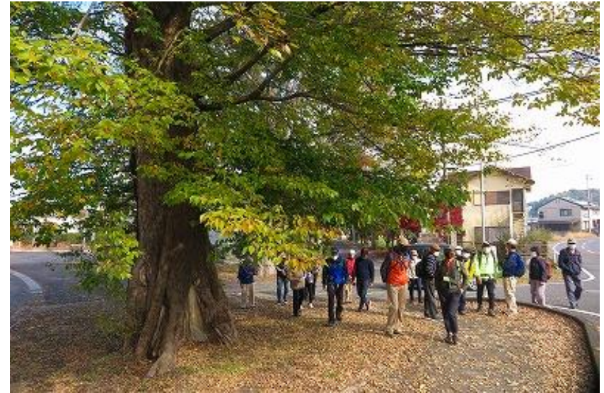
立派な巨木です。実のなる木ですが名前不明（すみません）