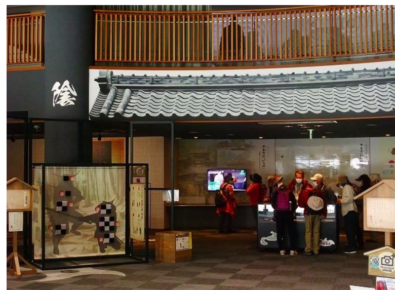
甲賀流リアル忍者館／昼食