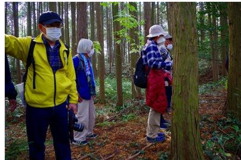
新宮城跡・新宮支城跡／木立に覆われた四角形の土塁に囲まれた城郭で16世紀頃に築かれたもの