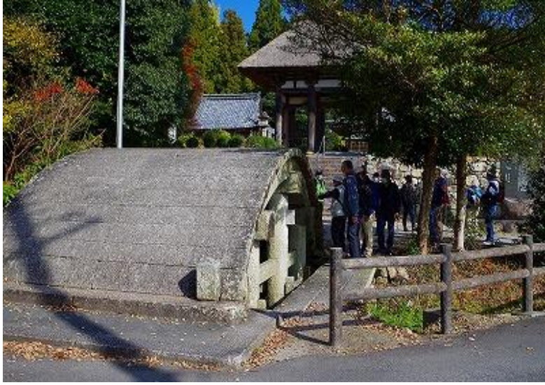
神様が渡る太鼓橋