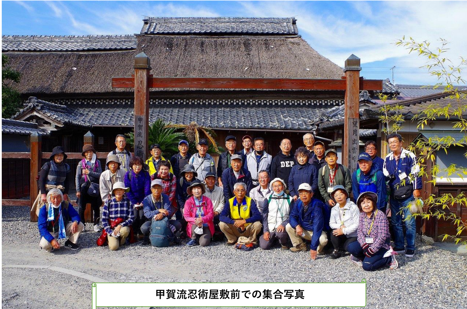
甲賀流忍術屋敷前での集合写真