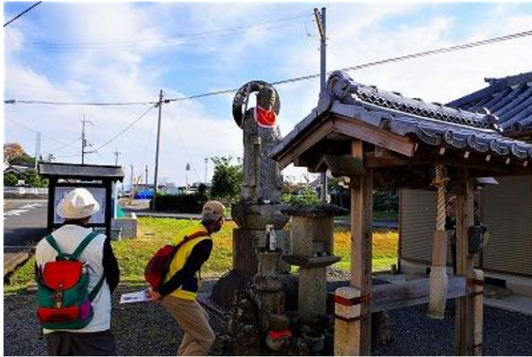
子安地蔵／早馬にはねられた子供の供養塔