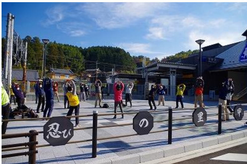
出発前の恒例の準備体操